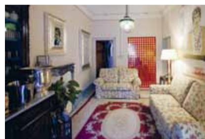
Palazzo Visdomini Pietrasanta