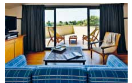
Terme della Versilia Villa Undulna Cinquale