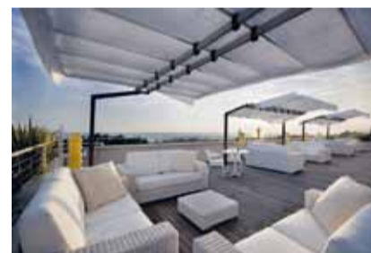
Hotel UNA Versilia Lido di Camaiore