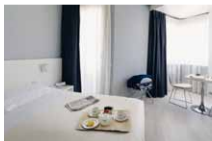
Hotel UNA Forte dei Marmi Forte dei Marmi