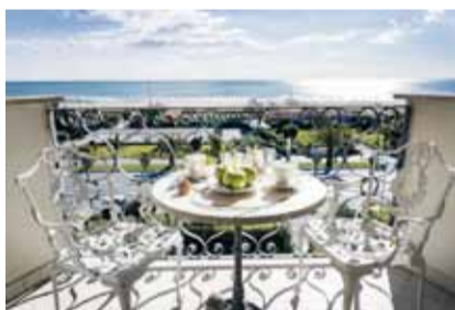
Hotel Il Negresco Forte dei Marmi