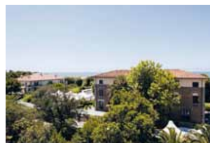
Park Hotel Villa Ariston Lido di Camaiore