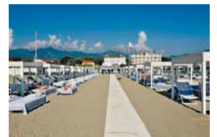
Hotel Villa Grey Forte dei Marmi