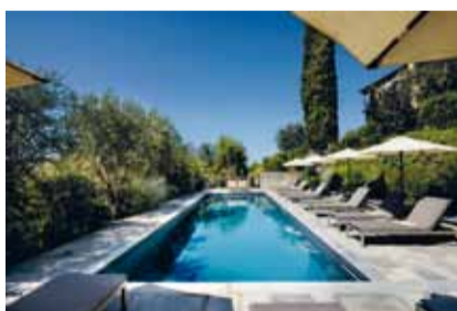
Locanda al Colle Camaiore