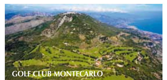
GOLF CLUB MONTECARLO

Infos & Buchung auf www.italiagolftours.com oder rufen Sie uns an: 0039 0584 1660566