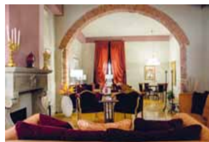
Hotel San Luca Palace Lucca